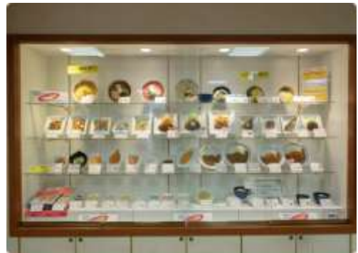
種類豊富なメニュー↑

営業時間は平日10時半~19時ですが、麺コーナーは15時までで営業終了し、麺コーナー以外も15時半からはビュッフェ形式になります。