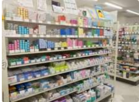
種類豊富な歯ブラシ↑

組合員証を提示することで書籍・雑誌は定価から1割引、文房具は2割引で購入することができます。店頭置いていなくても、取り寄せて貰うことができます。また、10人以上で共同購入する場合はさらに安くなって12%offになりますので(アマゾンプライムより安い!)、店員さんに相談してみてください。営業時間は平日10時~19時です。